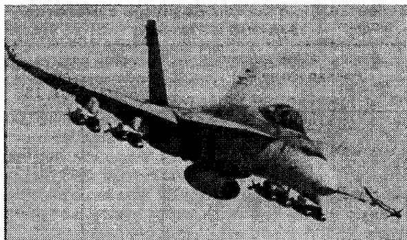
Истребитель-штурмовик F/A-18 авиации морской пехоты США

Однако поступление на вооружение ВМС США этих боевых самолетов ожидается приблизительно в 2010-2015 гг. Потому гораздо более актуальной сегодня для ВМС является задача поддержания на требуемом уровне возможностей нанесения ударов по наземным целям у существующих типов самолетов.